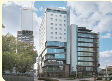
2022年12月オープン コンフォートホテル四日市 (2~5F本社事務所)

1つは、フロントマンやベルボーイなどの接客部門。もう1つは、 パーティーやイベントの企画、セールス担当の営業、広報など事務 部門です。どちらにしても、さまざまなサービスでお客様に快適 にご宿泊いただくためのお手伝いをしています。